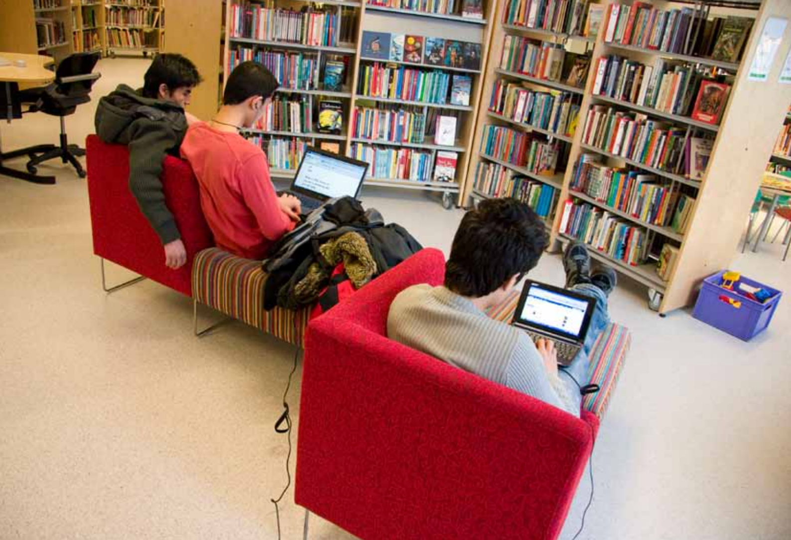
Frå Gloppen folkebibliotek, som var nytt i 2008

// Biblioteka i Sogn og Fjordane skal vere lågterskel-tilbod med gode sosiale møtestadar, aktive formidlarar, leggje til rette for kultur- og kunstoppleving og gi fri tilgang til kunnskap og informasjon.