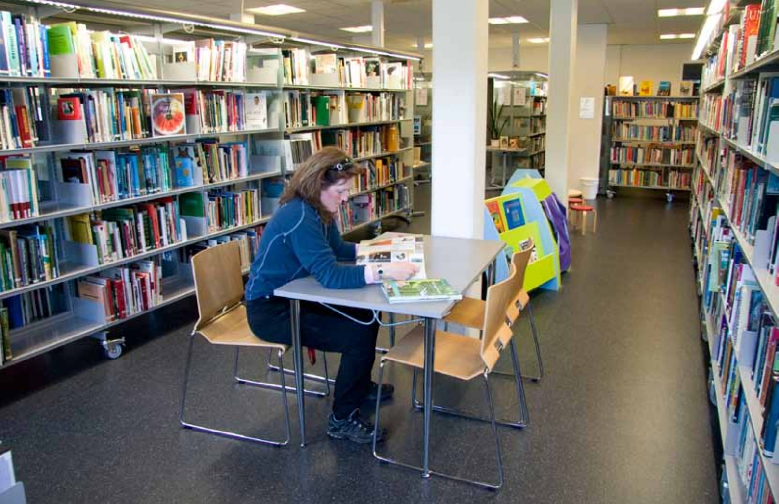
Frå nye Eid bibliotek

// Biblioteka er reiskapar for innbyggjarane si deltaking i og tilgong til informasjons- og kunnskapssamfunnet