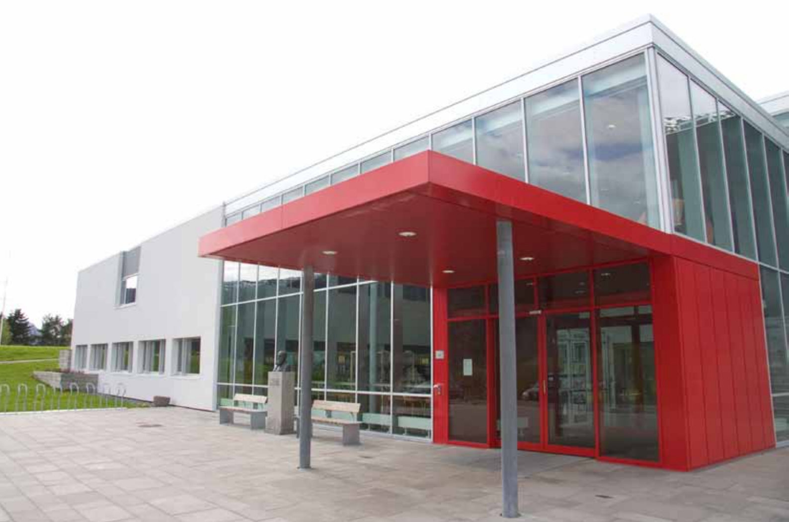
Operahuset på Eid, der biblioteket har lokale

// Utviklinga av folkebiblioteket både som digital tenesteformidlar og som ein fysisk møtestad understrekar at kommunane bør tenkje både samhandling og samlokalisering for dei aktivitetane og oppgåvene som dei utfører på kulturfeltet.