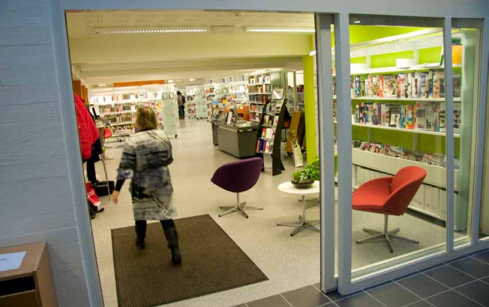
Årdal bibliotek fekk nye lokale i 2010

// Folkebibliotekene skal ha til oppgave å fremme opplysning, utdanning og annen kulturell virksomhet gjennom informasjonsformidling og ved å stille bøker og annet egnet materiale gratis til disposisjon for alle som bor i landet. (Frå §1 i Lov om folkebibliotek)